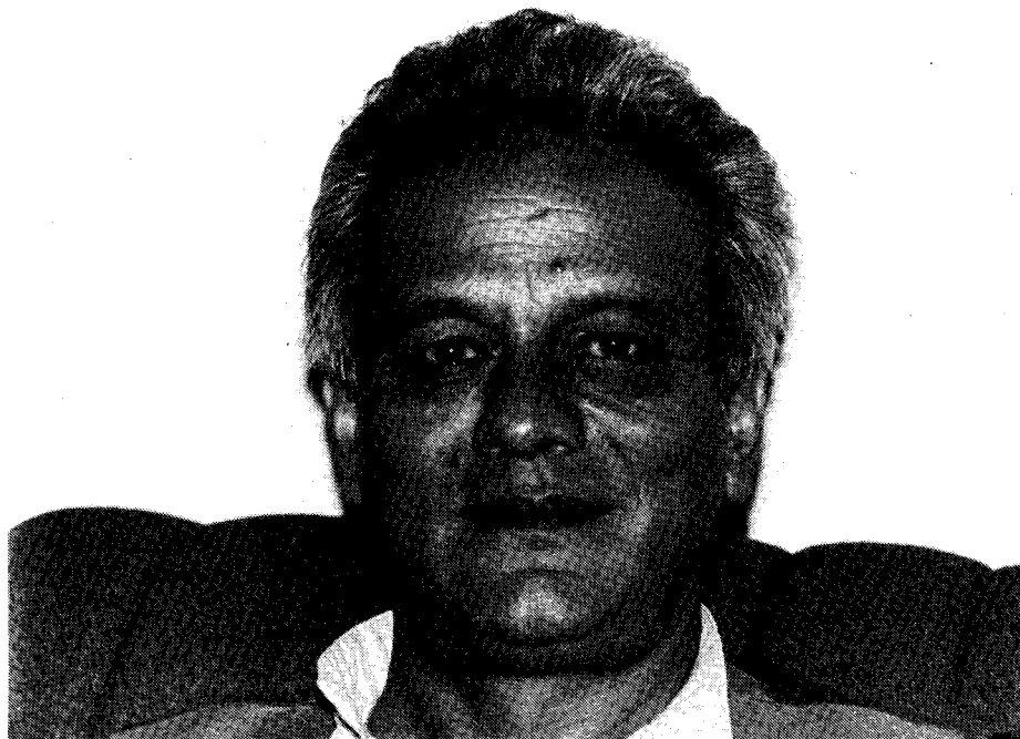
Nepals neuer Premier Chand

Wie ist der neue Premierminister Nepals einzuschätzen? Chand machte im vorletzten Parlament des Panchayat-Systems erstmals von sich reden, als er 1983 den damaligen Premierminister Surya Bahadur Thapa, den heutigen Vorsitzenden der 'National Democratic Party', durch ein Mißtrauensvotum stürzte. Es war dies das erste und einzige Mal, daß von dieser erst nach dem Referendum von 1980 eingeführten Option Gebrauch gemacht wurde. Doch es gab zahlreiche Anhaltspunkte, daß jener Sturz Thapas vom Palast gelenkt wurde. Eine besondere Nähe zum Königspalast ist es auch, was Lokendra Bahadur Chand bis heute nachgesagt wird. Als im April 1990 die Grundfesten der Monarchie durch die demonstrierenden Volksmassen bedroht wurden, war es Chand, auf den König Birendra zurückgriff, um zu retten, was eigentlich schon längst verloren war, nämlich das parteilose Panchayat-Sy-