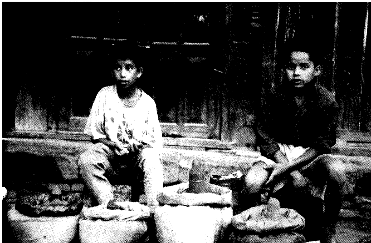
Nepal - Vielvölkerstaat