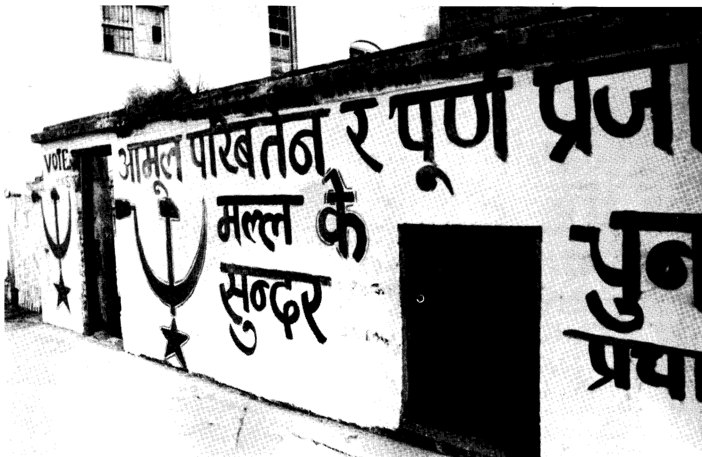
Graffiti der "Linken"

Die Antwort der Polizei war nicht weniger gewalttätig. Bei einem einzigen Zusammenstoß wurden sechs bäuerliche Aktivisten getötet. In Rolpa wurden in neun Dorfgemeinschaftskomitees (VDC), wie die lokalen Verwaltungseinheiten heute bezeichnet werden, etwa 1000 Polizisten stationiert. Nach Polizeiangab-