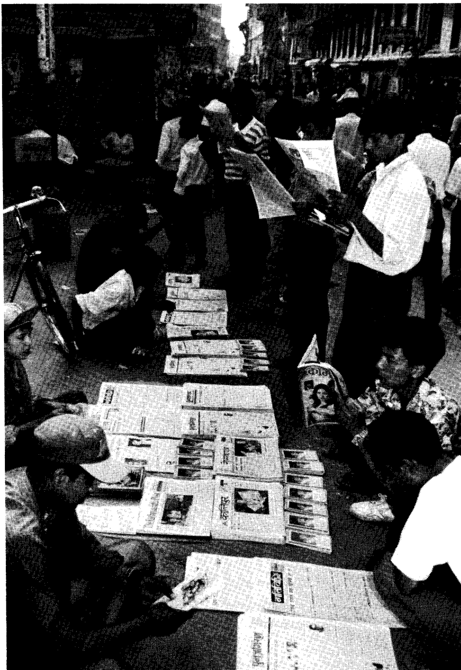
Mit großer Aufmerksamkeit verfolgte die Bevölkerung die politischen Turbulenzen der letzten Wochen

Da ist es umso unverständlicher, daß derselbe Oberste Gerichtshof sich nun von parteipolitischen Bestrebungen leiten läßt. Hätte die Reformpolitik der NCP-UML Regierung fortgesetzt werden können — und vieles deutet darauf hin, daß diese Partei eben wegen ihrer für die Massen so positiven Politik bei den ursprünglich für November angesetzten Neuwahlen eine deutliche