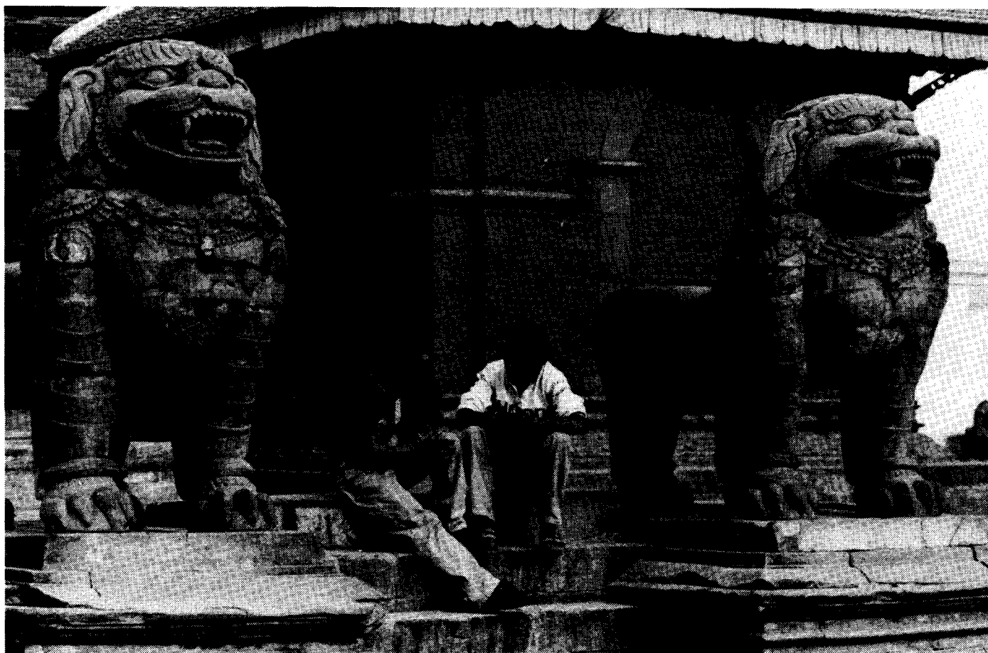
... die mannigfaltigen wirtschaftlichen Probleme der Bevölkerung zu lösen im Stande ist

vorsichtig eingeleitete Gesellschaftsreform, die auf der lokalen Ebene ansetzen muß, unter der neuen Regierung keine Chance haben wird.