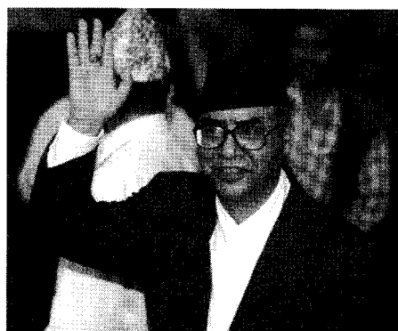
Comeback von Königs Gnaden: Expremier Deuba ist wieder Regierungschef