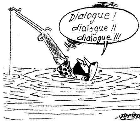
Maoisten unter Druck (nepalesische Zeitschriftenkarikatur)

Im Augenblick deutet alles auf eine Zweiteilung des Nepali Congress hin. Damit wäre diese Partei in einer ähnlichen Situation wie ihr Hauptgegner, die Communist Party of Nepal (Unified Marxist-Leninist) oder CPN-UML bei den vorigen Parlamentswahlen. Letztere hatte sich im Frühjahr 1998 gespalten, was zu ihrer Wahlniederlage im Mai 1999 führte. Zählt man die Stimmen zusammen, die damals beide Splittergruppen erhalten haben, hätte die CPN-UML 1999 erstmals eine absolute Mehrheit der Sitze im Repräsentantenhaus erhalten. Nach der Wiedervereinigung der CPN-UML im Februar 2002