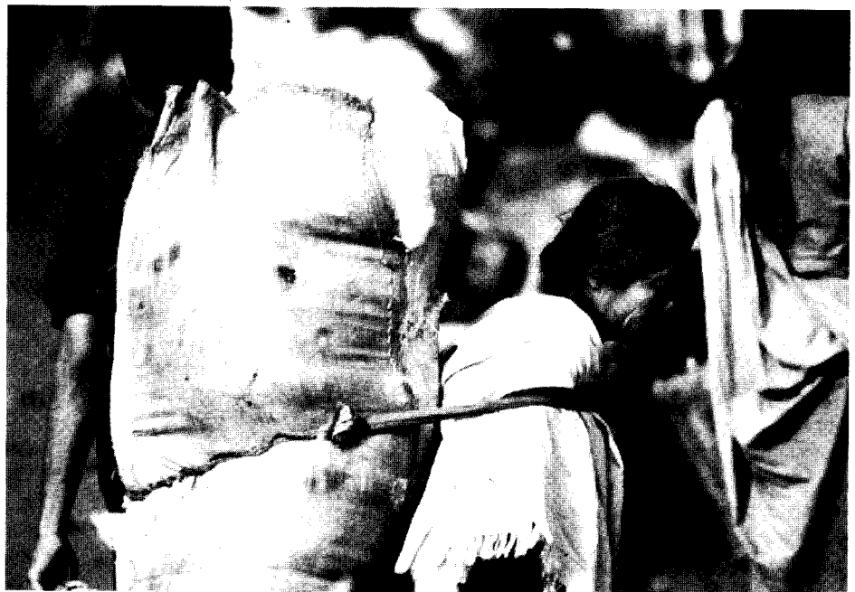
Harte Arbeit prägt den Alltag der Sherpas

Ein allgemeiner Anlaß für die Auflösung einer Ehe ist aus Sicht der Frau die Behandlung, die sie durch ihren Mann erfährt. Viele geschiedene Frauen geben an, sie seien von ihrem Mann zu schlecht versorgt worden, oder aber es habe oft Streit gegeben und der Mann habe sie ständig geschlagen. Schließlich ist auch noch als Grund zu nennen, daß der Mann nach Indien oder nach