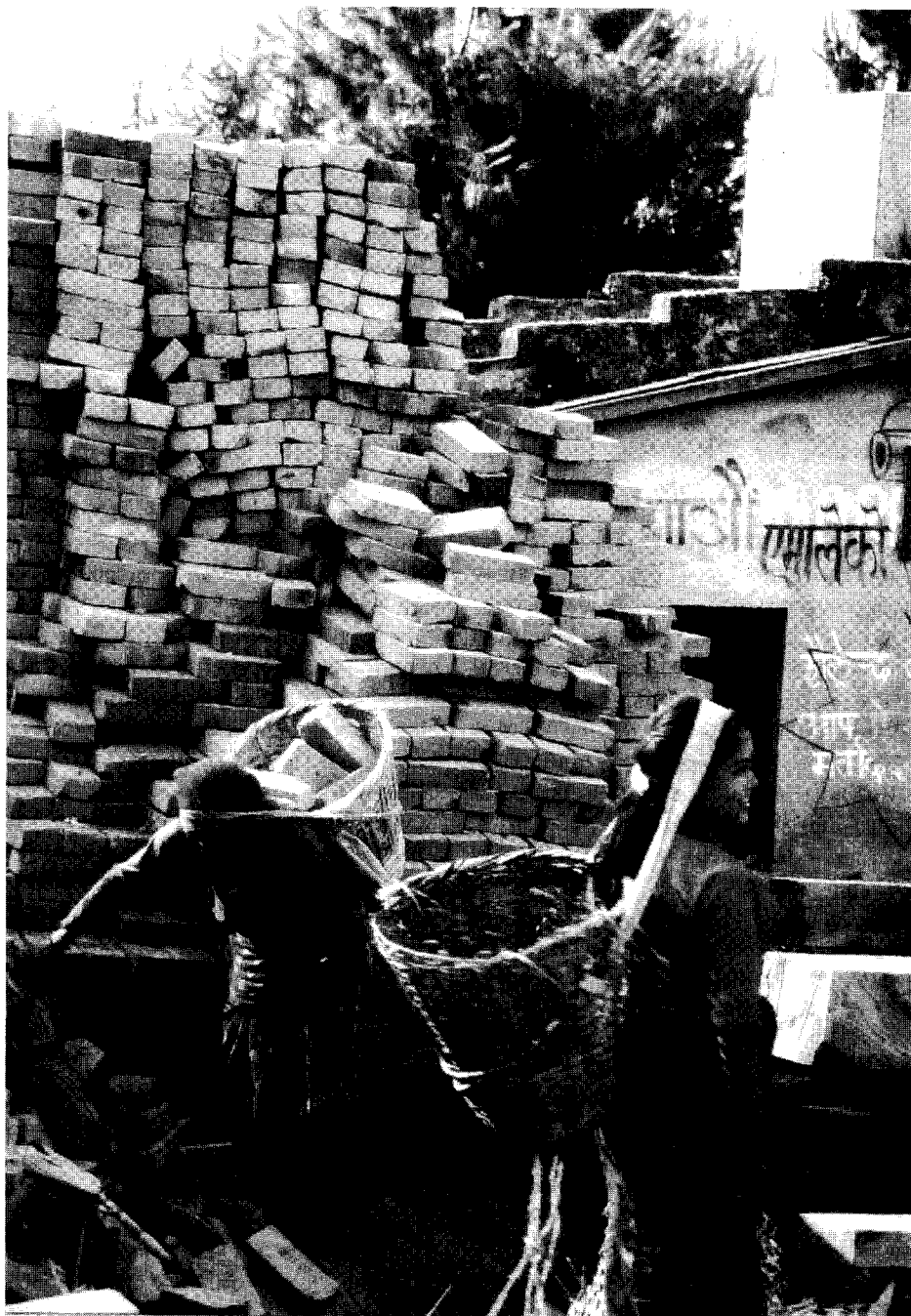
Frauen in Nepal beim Hausbau

Auch nach dem Eintritt ins Kloster unterhalten die Nonnen einen sehr engen Kontakt zur Familie im Dorf. So kommen sie beispielsweise regelmäßig, um die Familie bei den zahlreichen Arbeiten auf dem Feld zu unterstützen. Falls die Aufgaben im Kloster dies zulassen, kann ein solcher Aufenthalt im Dorf durchaus zwei bis drei Monate dauern. Lediglich die Tempeldienerin, ein Amt, das alljährlich neu vergeben wird, ist für ein Jahr fest ans Kloster gebunden.