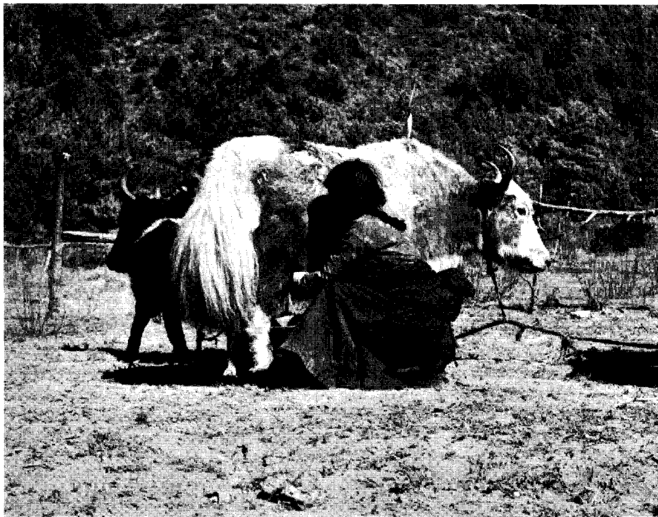
Sherpafrau beim Melken einer Nak (weibliches Yak)

Das Fest dauert die ganze Nacht hindurch, wenn die Leute nicht schon vorher von der Müdigkeit überwältigt