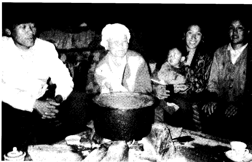
Die offene Herdstelle ist kommunikativer Treffpunkt der Familie

eine Nichte seiner Frau. Auf solche Dinge ließen sich nur arme, dumme oder körperlich behinderte Frauen ein. In diesem Fall war das Mädchen sehr arm.