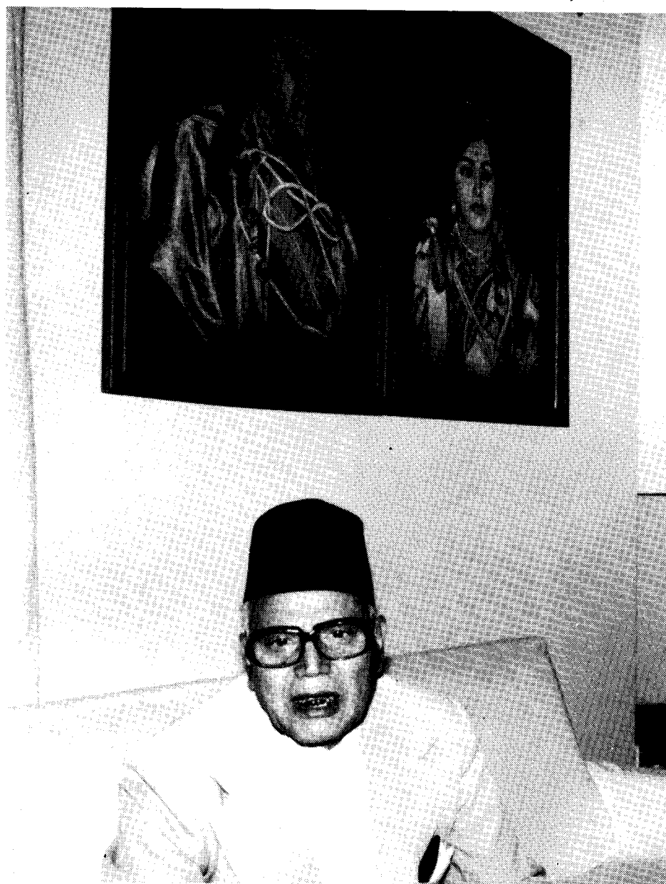
Die besten Chancen auf das Amt des Premierministers haben K. P. Bhattarai ('Congress Party') ...

Die beiden großen Regierungsparteien begannen mit dem Wahlkampf quasi unmittelbar nach der neuen Regierungsbildung. Viele Fragen waren zu jenem Zeitpunkt noch offen. So mußte sich die neue Regierung zunächst noch der Vertrauensfrage im Parlament stellen. Auch die Dauer der Sitzungsperiode war völlig umstritten; selbst Politiker des 'Nepali Congress', wie Parlamentssprecher Ram Chandra Poudyal, forderten eine vollständige Sitzungsperiode, da viele Gesetzesvorlagen zur Entscheidung anstünden. Ungeachtet derartiger noch